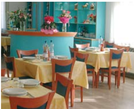
Luminosa sala da pranzo, dotata di servizio bar

Il pagamento avviene con autorizzazione all'addebito diretto in conto corrente bancario o attraverso versamento in assegno o contanti in ufficio, sulla base delle presenze mensili.